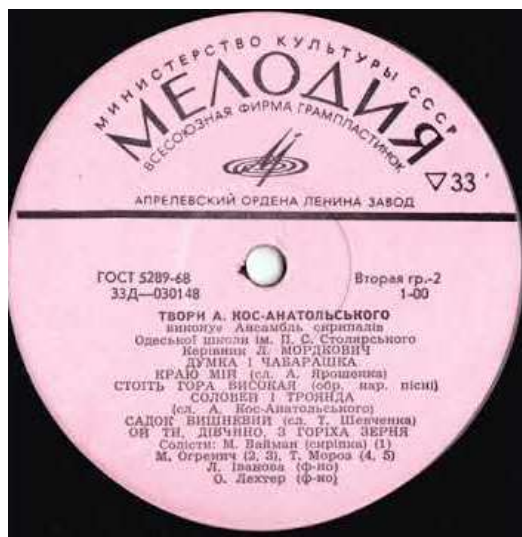
Грампластинка з творами А. Кос-Анатольського

Карпатське озерце [Ноти] / муз. А. Кос-Анатольського, сл. С. Жупанина // Пісенник : зб. пісень для 5-8 кл. загальноосвіт. шк. / упоряд. В. Я. Кващук. – Тернопіль, 1999. – С.23-24.