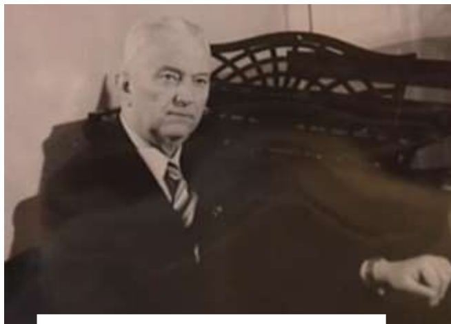
А. Кос-Анатольський в

Голочка [Ноти] / муз. А. Кос-Анатольського, сл. І. Кульської // Пісенник. 3 кл. : найповніше зібрання програм. творів / упор. Н. І. Вислоцька. – Тернопіль-Харків, 2010. – С.66-67.