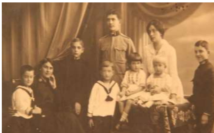
Родина А. Кос-Анатольського

Вступивши до університету, Анатоль не кидав думки про музику. В кінці 1928 року він став студентом Львівського вищого музичного інституту ім. М. В. Лисенка по класу фортепіано талановитого піаніста професора Тараса Шухевича. У музичному інституті Анатоль став активним членом студентського гуртка «Домінанта». На засіданнях гуртка студенти дискутували, обговорювали новини музичного життя, грали нові твори. Члени гуртка — студенти композиторського факультету виконували свої композиції. На одному із таких засідань Анатоль Кос прочитав товаришам свій реферат, присвячений композитору Ф. Шопену. В цей час він уже писав і свої перші музичні твори, проте показувати друзям ці проби пера не наважувався.